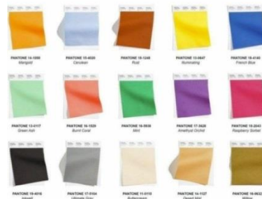
Gambar 5. Trend Fashion Color 21/22

Warna yang akan digunakan dalam konsep Tugas Akhir ini adalah warna hitam, putih dan coklat.