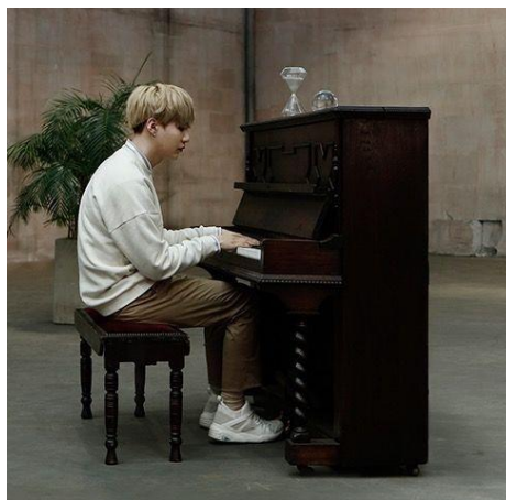
Gambar 1. Suga dan Piano Coklat

Album WINGS merupakan salah satu album BTS yang menceritakan tentang bagaimana proses seseorang untuk mencari jati diri yang sebenarnya. Album yang diciptakan terdapat 15 lagu, ada 7 lagu solo yang di bawakan tiap member. Setiap lagu di buat sesuai dengan pengalaman masing-masing dan menghasilkan plot yang indah. Suga dalam album WINGS First Love, yang merupakan salah satu track solo membuat banyak orang tertipu dengan judul lagunya. Banyak orang beranggapan bahwa Suga, salah satu member BTS ini akan bercerita tentang seseorang yang dicintainya pada masa lalu. Pada kenyataannya, Suga bercerita dalam lirik lagunya bagaimana dia bertemu cinta dan pasangan yang sesuai terhadap musik untuk pertama kalinya dari piano cokelat yang berada disisi rumahnya semasa kecil dulu.