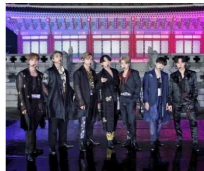
Gambar 4. Member BTS menggunakan busana Hanbok