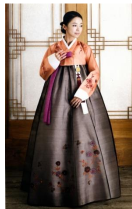
Gambar 3. Hanbok era dinasti Joseon.