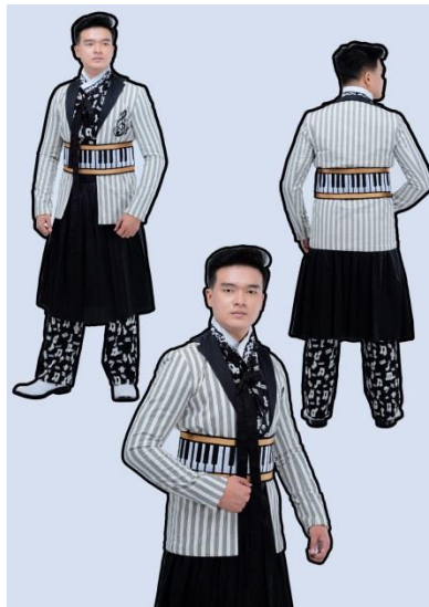
Gambar 15. Foto Model Desain 2