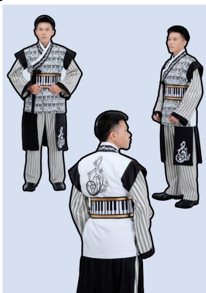
Gambar 13. Foto Model Desain 2