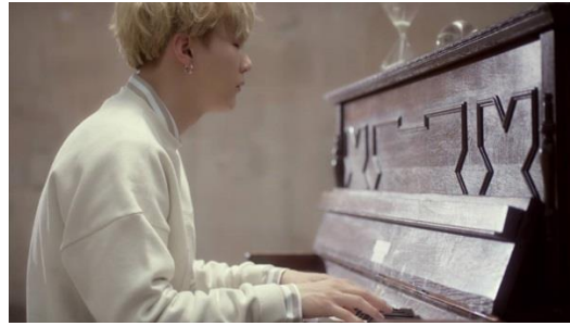
Gambar 2. Suga bermain Piano Coklat

Sebuah memori akan piano coklat ketika dia masih kecil yang ada di rumah Yoongi. Piano itu terlihat sangat besar dan mengagumkan di mata Yoongi. Sejak saat itu, sang Piano mengenalkannya pada cinta dan pasangan yang sesuai terhadap musik. Tak ada hari yang di lewatkan tanpa sang piano. Suga kecil benar-benar jatuh cinta padanya. Rasa rindu pun tumbuh dan menghangatkan hati seorang Yoongi kecil.