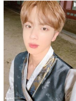
Gambar 16. Detail Make Up