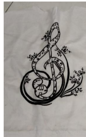
Gambar 9. Teknik Bordir