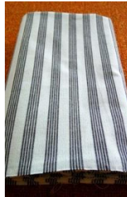
Gambar 6. Kain Lurik

Kain lurik merupakan kain tenun yang memiliki motif garis-garis searah panjang kain. Kata lurik diambil dari Bahasa Jawa “lorek” yang berarti lajur atau garis dan dapat pula berarti corak. Kain lurik sendiri memiliki nilai sejarah yang sangat tinggi terutama di wilayah Yogyakarta dan Jawa tengah. Kain tradisional ini diperkirakan ada sejak jaman kerajaan Mataram yang dibuktikan dengan adanya prasasti yang mengenakan kain lurik.