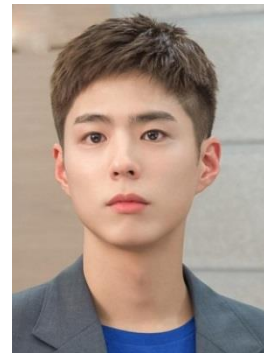
Gambar 17. Detail Hair do