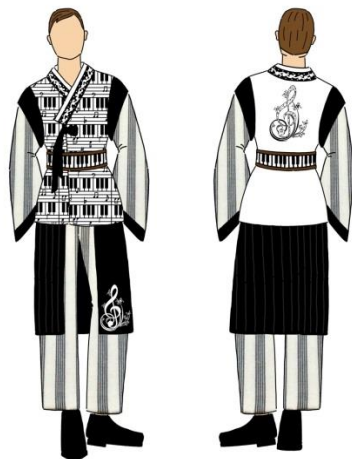
Gambar 12. Ilustrasi Desain 2