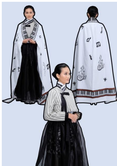
Gambar 11. Foto Model Desain 1