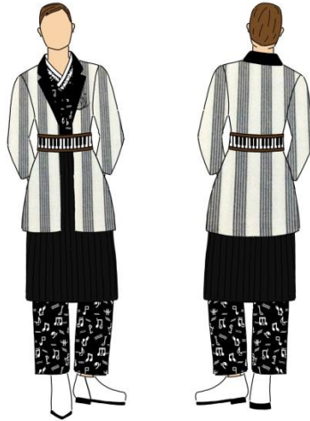
Gambar 14. Ilustrasi Desain 2