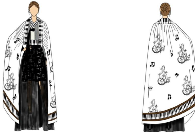
Gambar 10. Ilustrasi Desain 1