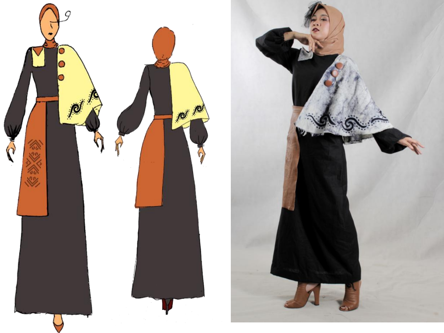
Gambar 4. Ilustrasi Desai 3

Rancangan desain ketiga berupa dress panjang dengan siluet A, lengan balon dan tambahan half cape pada bagian pundak kiri.