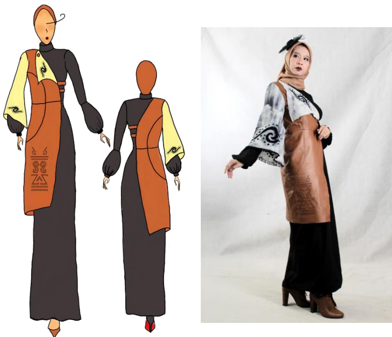
Gambar 2. Desain ilustrasi 1

Rancangan desain yang pertama berupa dress panjang lurus dan turtle neck dengan lengan balon pada bagian bawah lengan dan lurus dari bahu hingga pergelangan tangan. Ditambah half outer yang asimetris.