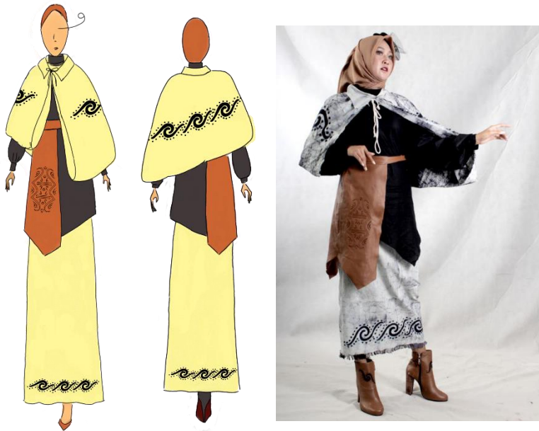
Gambar 3: Desain ilustrasi 2

Rancangan desain kedua berupa atasan dengan potongan asimetris dan lengan balon, bawahan rok lurus dan tambahan cape gantung yang di ikat.